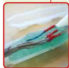
AANSLUITINGEN ONDER WATER