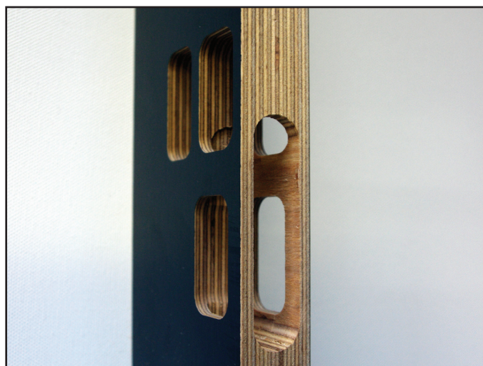
afb. 2 - Uitsparing voor de afvoer van de krullen

De mal wordt geleverd met een aluminium strip van 5 mm dik. Dit dient als beschermlat of als kadervulling.